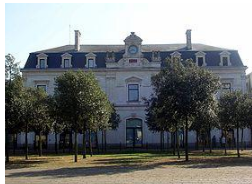
CONGRES du SNAPcgt Maison des Syndicats Place de la Gare de l'Etat

De la Gare SNCF accès Nord : Tramway 1 vers F.Mitterrand/Jamet - arrêt « chantiers navals », traverser la Loire et poursuivre après les « Machines » jusqu'au Bd de la Prairie au Duc... C'est presque en face à gauche (5-8 minutes à pieds)